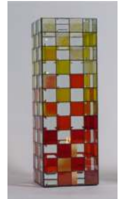
Kerzenleuchter Nr. 3-XL