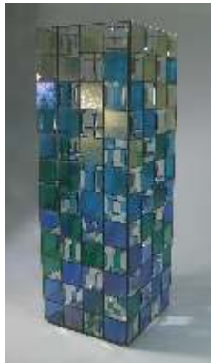
“ Caribbean Flair “

96 Facetten/Bevels 51 x 51 mm ( 2" x 2" ) Artikelnummer 85 130 02