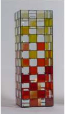
“ Feuer und Flamme “

96 Facetten/Bevels 51 x 51 mm ( 2" x 2" ) Artikelnummer 85 130 02