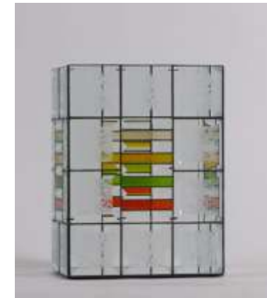
Kerzenleuchter Nr. 4